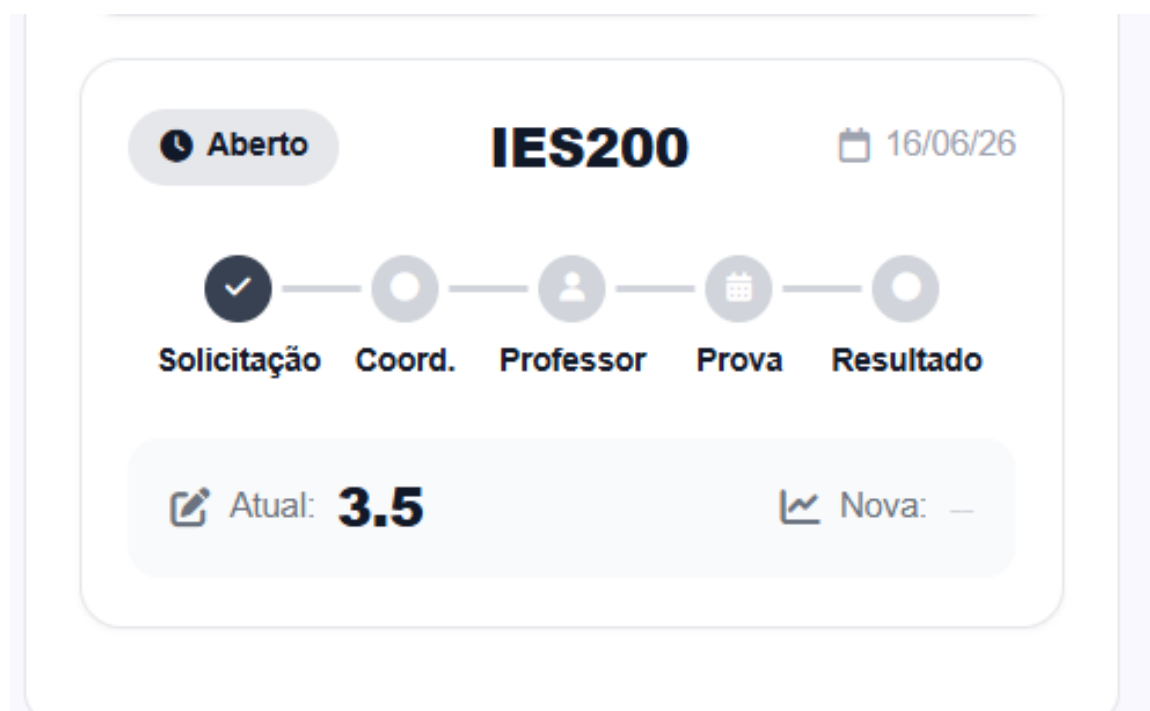
Figura 3 - Tela do processo de Exame Final.

Após a solicitação, o sistema apresenta a linha do tempo do processo com a nota atual na disciplina.